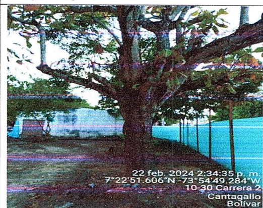
fotografía 4 árbol de almendro incluido en la solicitud