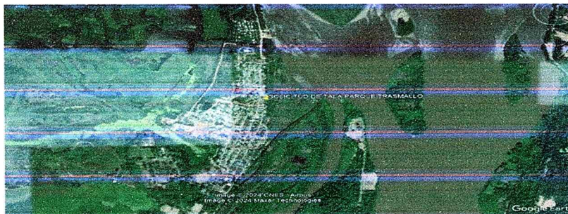
Ilustración 1: Área solicitud de Tala PARQUE TRASMALLO (Google Earth)