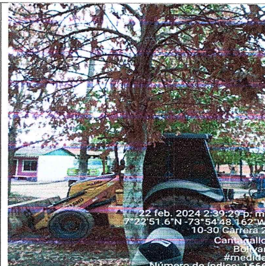
fotografía 2 árbol de Pomarrosa incluido en la solicitud luego de la visita